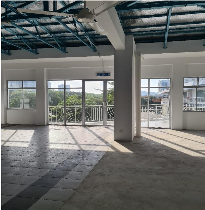
Ruang Tingkat Atas Bangunan Bus Interchange' Dan 'Overhead Linkway'

CMI sebagai pemilik bangunan akan memeterai Perjanjian Konsesi bersama Pembida yang berjaya bagi tempoh 5 + 5 tahun di bawah terma-terma dan syarat-syarat yang dipersetujui bersama.