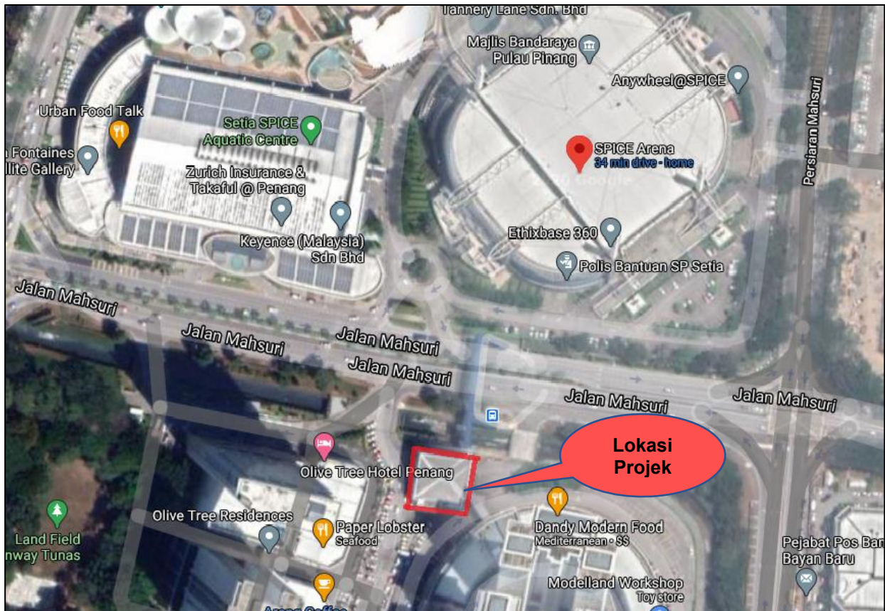
Pelan Lokasi Bangunan 'Bus Interchange' Dan 'Overhead Linkway', Mukim 12, Daerah Barat Daya (DBD), Pulau Pinang