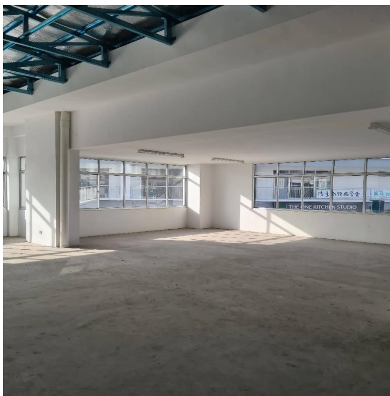
Ruang Tingkat Atas Bangunan Bus Interchange' Dan 'Overhead Linkway'